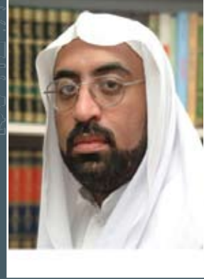
بقلم : محمد محفوظ