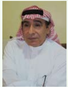
رياض محمد سعيد الجشي

الشاعر الذي يضعه الجميع ضمن المدرسة الكلاسيكية في الشكل والمضمون، رأوا فيه علامة فارقة في عالم القصيدة الشعرية التي شهدتها المحافظة خلال تاريخها الحديث، فهو امتداد لمدرسة الإحياء التي قادها