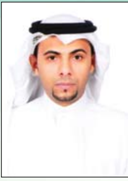
بقلم : السيد محمد المشعل