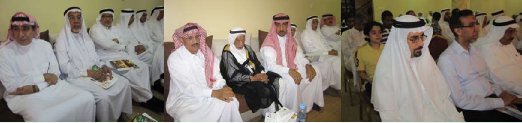
الشاعر محمد سعيد الخنيزي