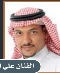
الفنان علي الجشي