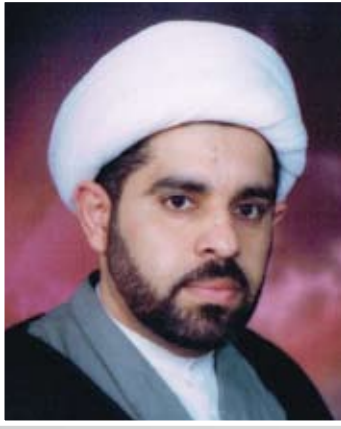
بقلم: سماحة الشيخ جعفر الريح