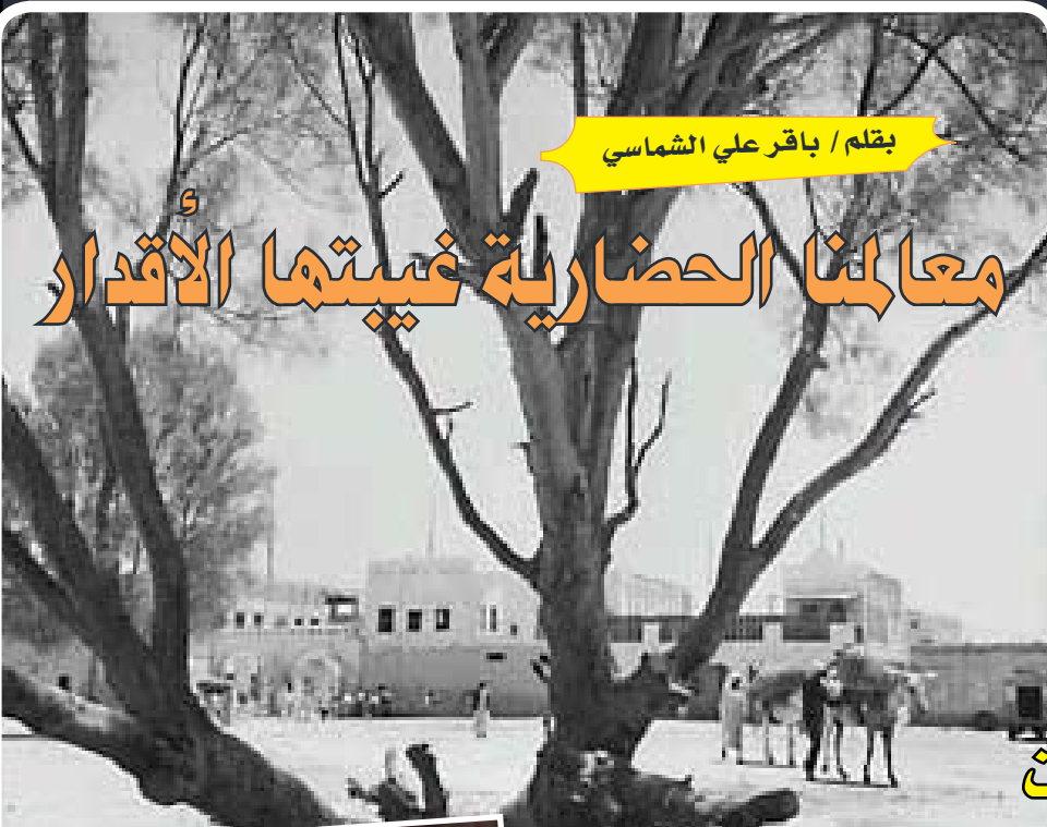
بقلم / باقر علي الشماسي