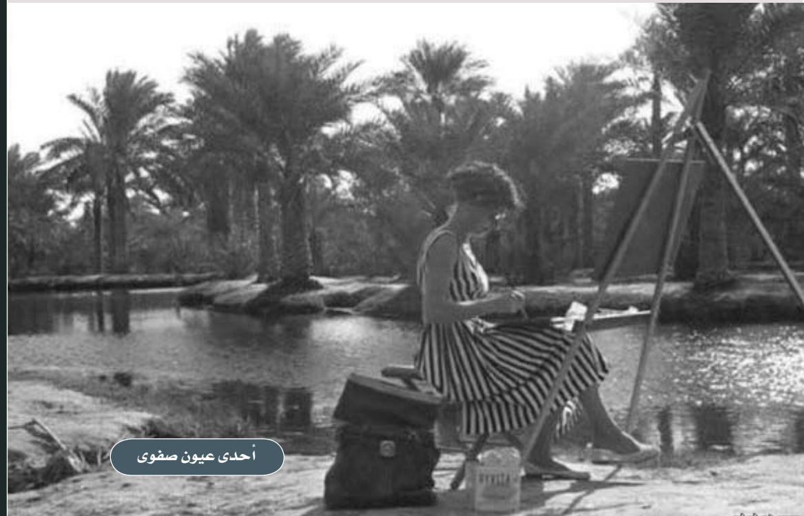
أحدى عيون صفوى

يعني ذلك أنهم أي المخططين قد شرعنوا أفعالهم تلك بهذا المنطق المأزوم ، والله أعلم .