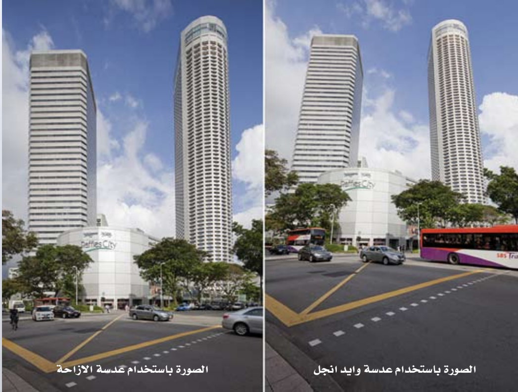
الصورة باستخدام عدسة الازاحة