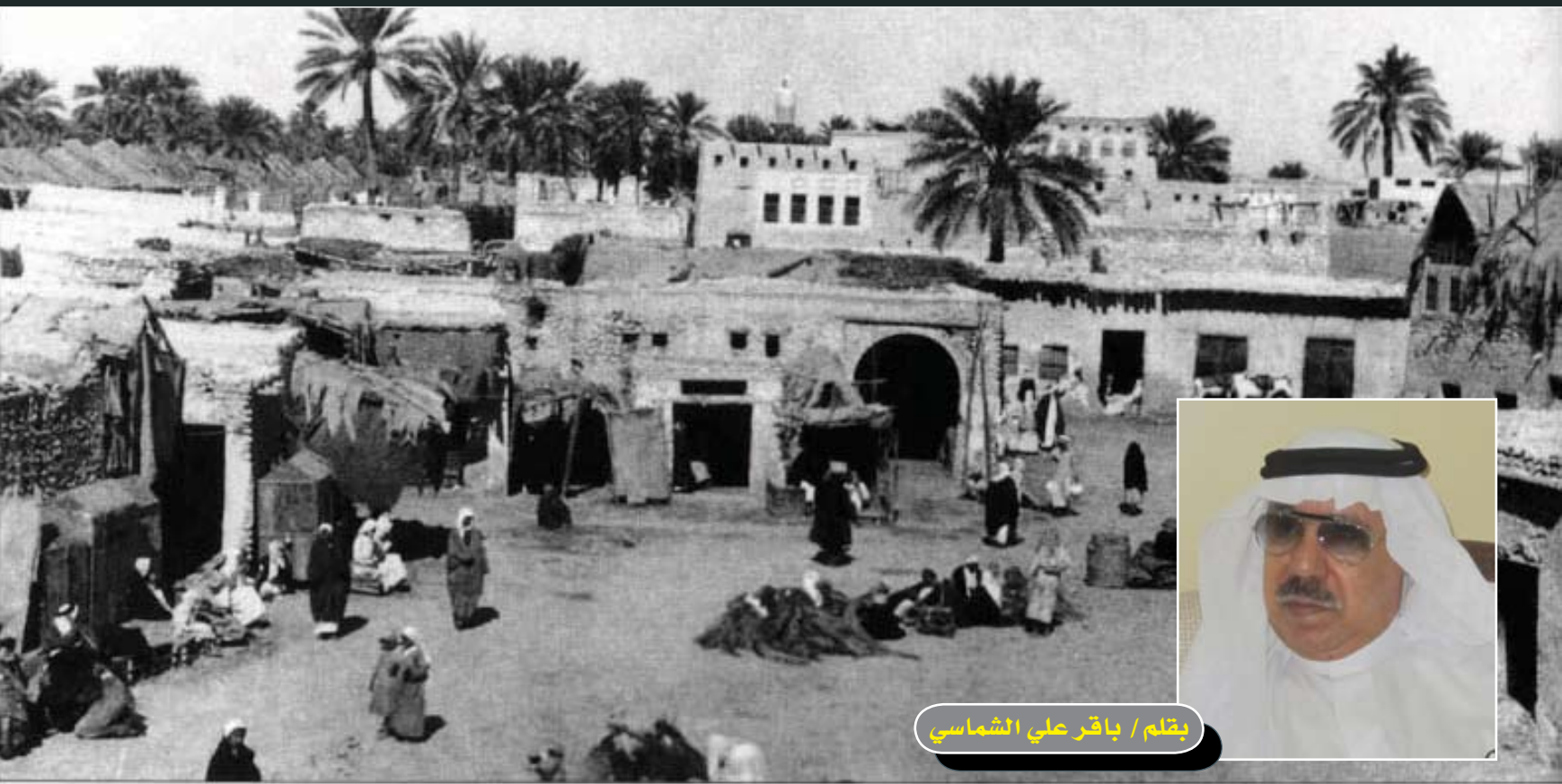
بقلم / باقر علي الشماسي