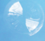
مشاريع الكهرباء Electrical projects