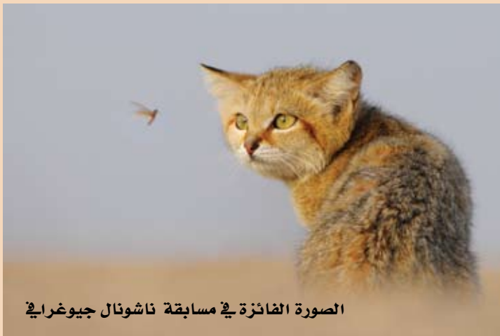
الصورة الفائزة في مسابقة ناشونال جيوغرافيا