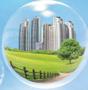
أعمال مباني Constructions