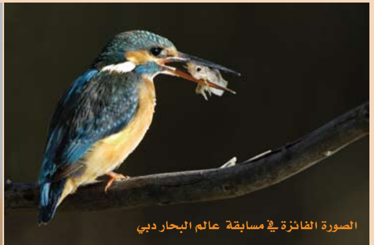
الصورة الفائزة في مسابقة عالم البحار دبي

وعندما سألته عن المصورين الذين يحب متابعة اعمالهم أجاب « مصورين كثر من احب متابعتهم ويعجبني المصور المتجدد بالأفكار الدائم التطوير لنفسه في اخر المعلومات التي تخص التصوير فمن مصوري حياة الناس تعجبني صور المصور العالمي ستيف ماكوري والمصور جوي إل وكذلك تصوير الطبيعة فأني احب صور انسل آدمز اما صور الحياة البرية فأتابع المصور الايطالي روبرتو بارتالوني»