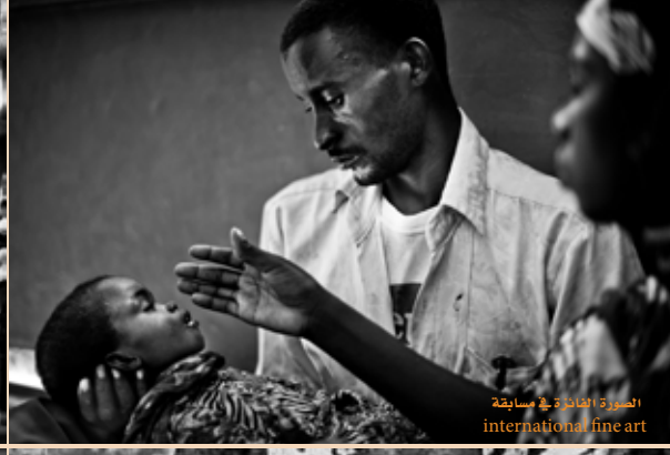
الصورة الفائزة في مسابقة international fine art