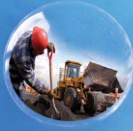
مشاريع بني تحتية Infrastructure Projects