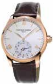
FREDERIQUE CONSTANT GENEVE