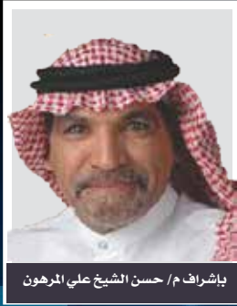
بإشراف م/ حسن الشيخ علي المرهون