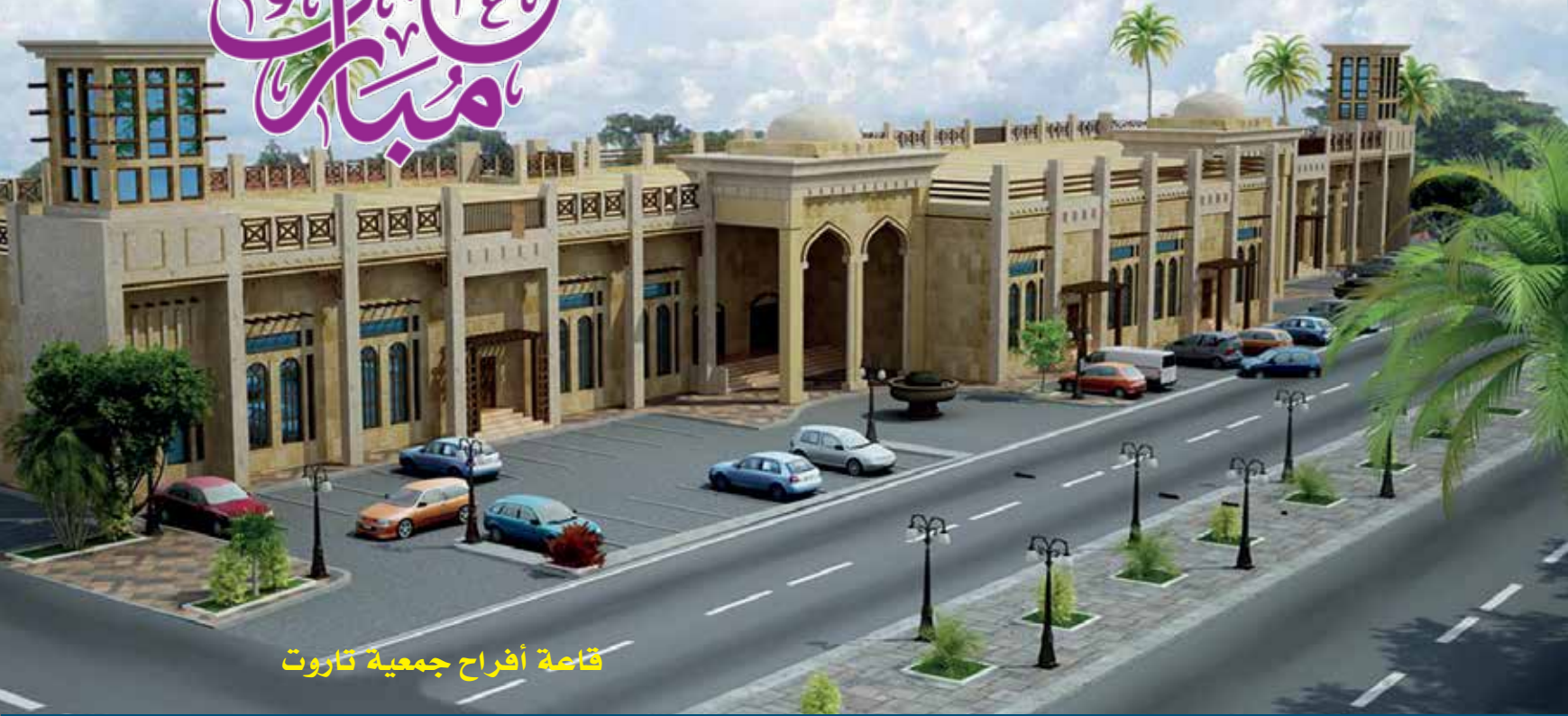
قاعة أفراح جمعية تاروت