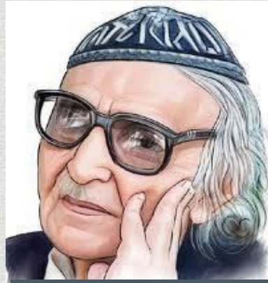
محمد مهدي الجواهري