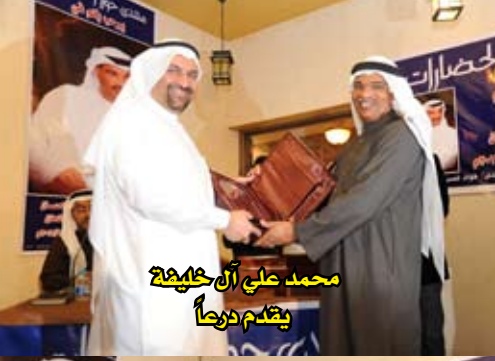
محمد علي آل خليفة يقدم درعاً